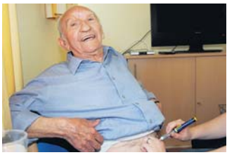
Vor dem Spritzen wird der Zuckerspiegel im Blut gemessen.