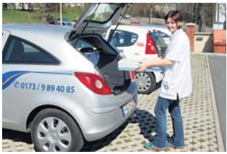
Noch vor der Abfahrt vom Pflegestützpunkt muss das Auto beladen werden.