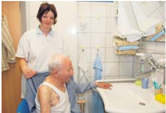
Beim Waschen und Anziehen ist die Schwester behilflich.