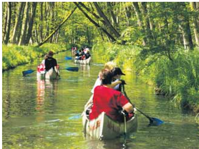
Viel Freude machte den Jugendlichen die Fahrt auf der mecklenburgischen Seenplatte.

Aller Anfang ist schwer, das mussten alle feststellen, die noch kein Paddel in der Hand hatten. Der Therapieeffekt liegt dabei in der Nutzung eines be-