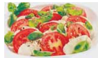
Farbenfroh und gesund sind die Salate der Mittelmeerregion. Tomaten, Mozzarella, Basilikum, Zitronensaft, Salz, Pfeffer und Olivenöl gehören dazu.

die Kalorien. Doch es sind auch die Tischgewohnheiten, von denen wir Mitteleuropäer lernen können. Das Essen ist im Süden ein tägliches Ereignis, das man mit Zeit und Ruhe angeht. Oft trifft man sich dazu mit der Familie oder Freunden und lässt sich auch ein Glas Rotwein schmecken. Für den Durst kann man in den meisten Städten das ganz