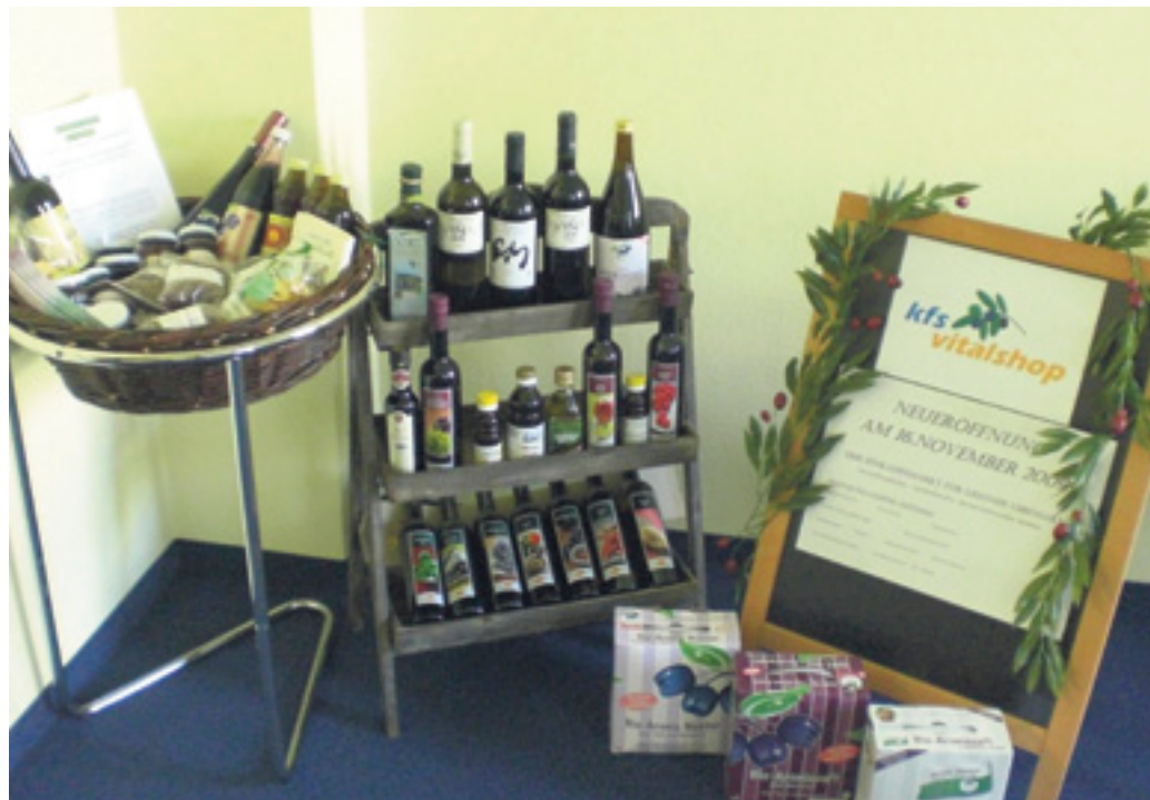
Versorgt seine Patienten und Besucher in Zukunft mit eigener Produktlinie: das Kreiskrankenhaus Freiberg eröffnet den Vitalshop am 16. November 2009.

So findet sich im Shop eine Auswahl an Brotaufstrichen, Honig, Säften aus der Region, Molkerei- und Sojaprodukten, kaltgepressten Ölen, Trockenfrüchten, Tees,