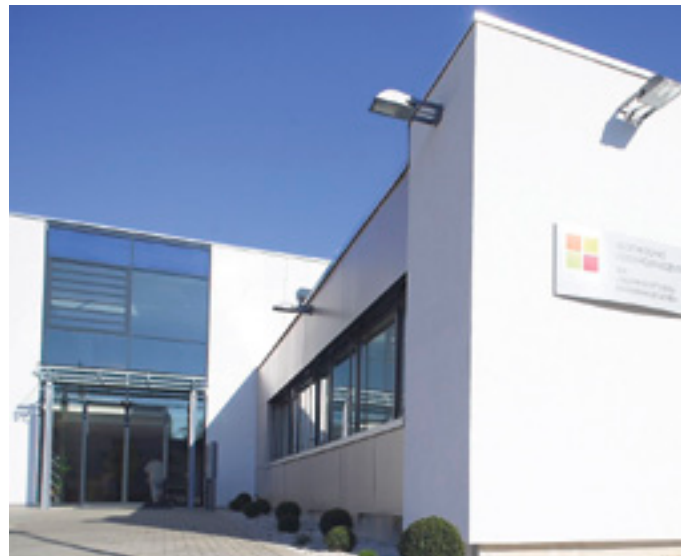
Das moderne Medizinische Versorgungszentrum in Mittweida ist ein Jahr alt geworden. Die Bilanz fällt durchweg positiv aus.

■ MVZ der Landkreis Mittweida Krankenhaus gGmbH Robert-Koch-Straße 3 09648 Mittweida Tel. 03727 / 99-1050