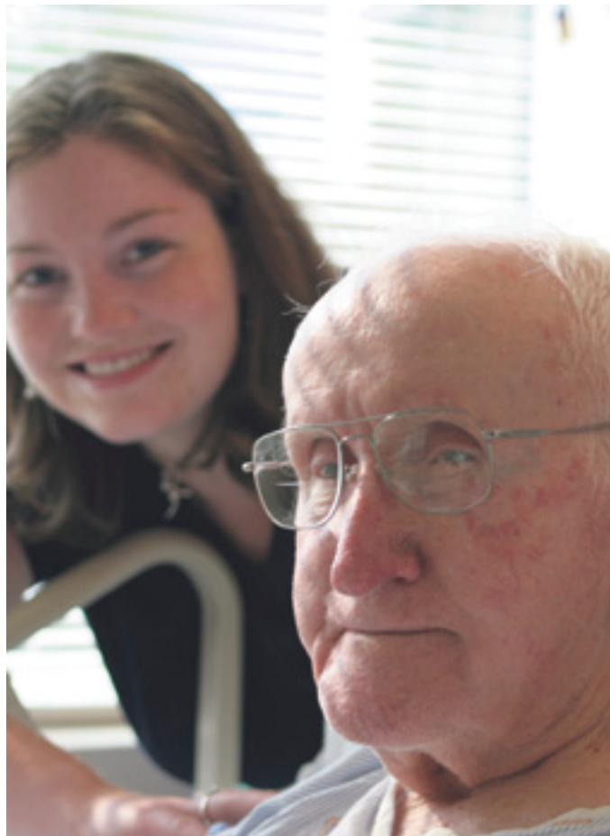
Alte Menschen brauchen in den Kliniken meist eine intensive pflegerische und ärztliche Betreuung.

Um dieses Ziel zu erreichen, muss das gesamte Arsenal medizinischer und sozial flankierender Maßnahmen eingesetzt werden. Dazu gehören auf der Basis einer individuell abgestimmten Kombination die Akutmedizin (ggf. Intensivmedizin), die Rehabilitation, die Palliativmedizin, Sekundärprävention, die Optimierung der Hilfsmittelversorgung und sozial flankierende Maßnahmen (ggf. Wohnraumanpassung).