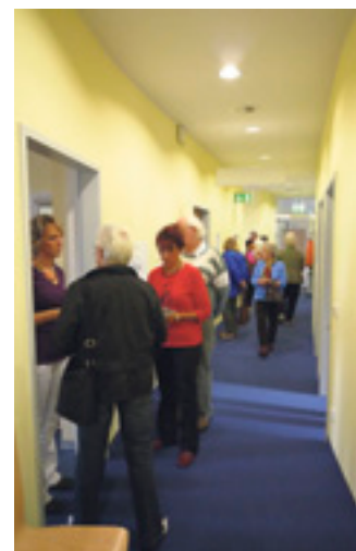
Großer Andrang beim Tag der offenen Tür.

Betroffenen Hilfe bei akuten, chronischen und psychosomatischen Erkrankungen.