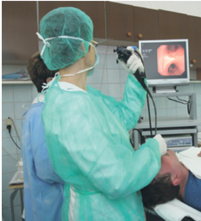
Die Bronchoskopie hilft bei der Diagnosestellung.

Der mit weitem Abstand wichtigste Risikofaktor ist der Zigarettenrauch, der allein Hunderte schädliche Substanzen enthält. Das Lungenkrebsrisiko steigt in Abhängigkeit von der Anzahl der gerauchten Zigaretten pro Tag und der Zahl der „Raucherjahre“ bis auf das 20- bis 30fache des Risikos eines Nichtraucherers. „Etwa jeder zehnte Raucher erkrankt im Laufe seines Lebens an Lungenkrebs, im Durchschnitt 30