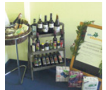
Wird am 16.11. eröffnet: der Vitalshop im Kreiskrankenhaus.

16.11.2009 Eröffnung des Vitalshops im Kreiskrankenhaus Freiberg mit einem umfassenden Angebot an Bioprodukten , angefangen mit speziellen Ölen und Olivenölen bis hin zu Sojaprodukten. Der Vitalshop liefert auch nach Hause.