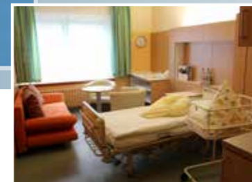
Unsere ansprechenden Familienzimmer